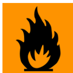
Helposti syttyvä Mycket brandfarligt

HARTSI: UN 1866 HARTSILIUOS (Sisältää: Metyylimetakrylaattia), 3, II, VAK